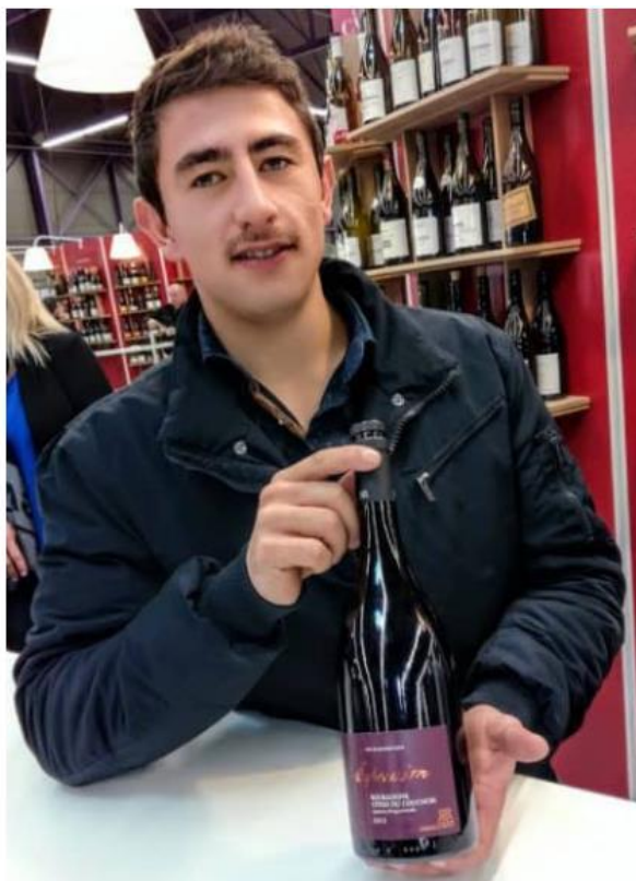
Ici à Beaune en novembre 2017, le domaine Royet présente sa cuvée Expression 2015, AOC Bourgogne Côtes du Couchois