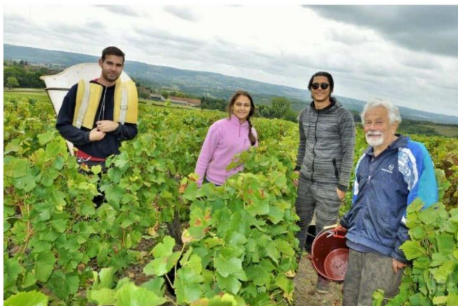
Dans les Côtes du Couchois, vendanges manuelles au domaine Royet à Couches