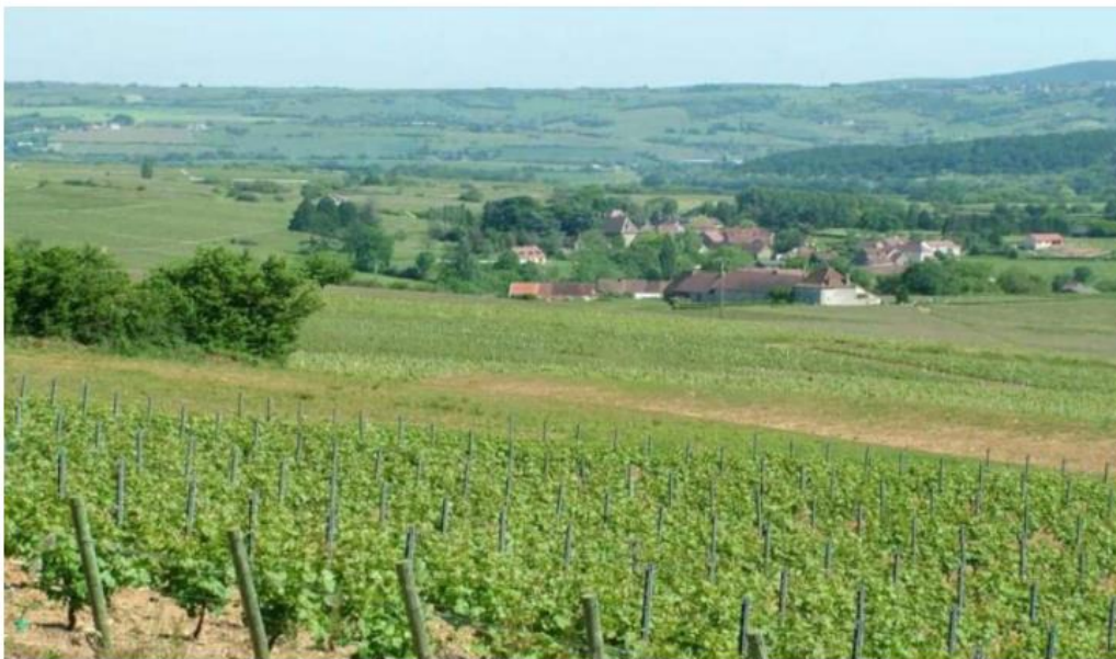
Les Côtes du Couchois est un vignoble très morcelé dans ce très tranquille paysage du sud Bourgogne.