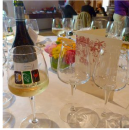
Si l'AOC Bourgogne Côtes du Couchois ne peut être aujourd'hui qu'un vin rouge issu du pinot noir, en revanche, les Côtes du Couchois se déclinent également en blanc (chardonnay et aligoté)

* Seconde fille de Robert II duc de Bourgogne, reine de France et de Navarre (1314-1315) par son mariage avec le futur roi Louis X le Hutin.