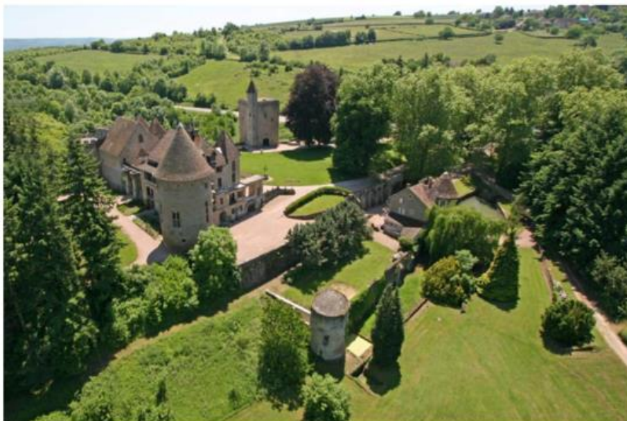
Le château de Couches dont le vignoble, un clos de 2 ha 83 est planté de pinot noir, chardonnay et aligoté (en production à partir de 2018).